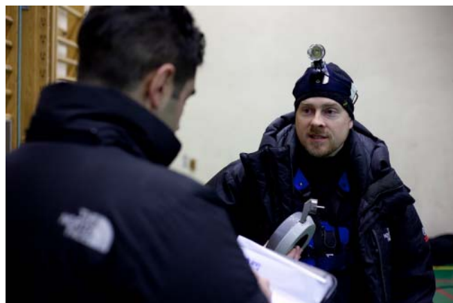
Patric blir intervjuad av Osan (?) från IFH.

Detta skulle bli för mig som tävlingsledare och klubbens andra MSBN, förra gången var vi vid Hellas klubbstuga Granby 2005, där visste man