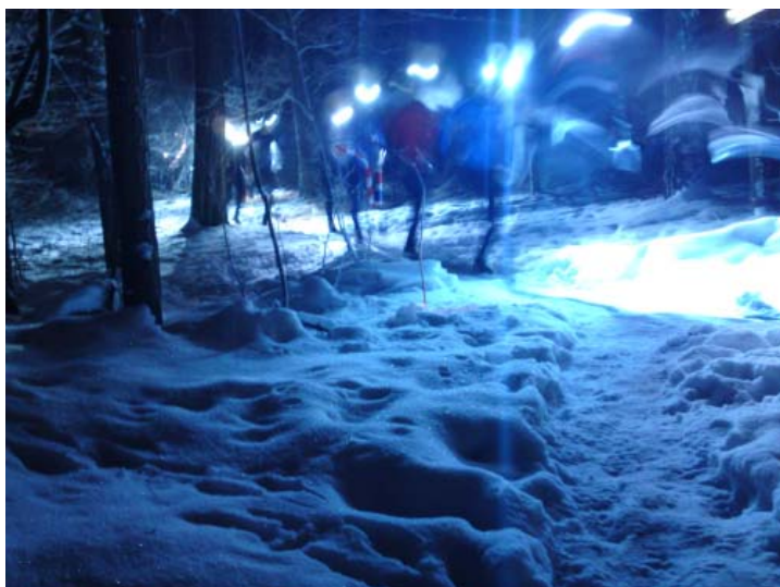
Herrarna passerar startpunkten.

Sen var det ju inte så mycket att göra under själva tävlingen. Förutom att